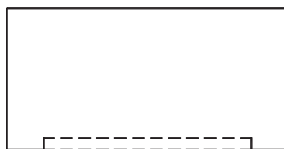
Plaque supérieure - Upper plate