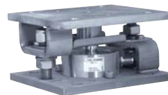
Kit de montage Silokit-R - Silokit-R mounting kit